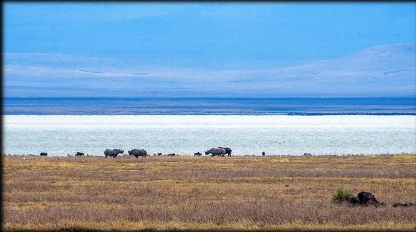
Nr. 1: Es gibt sie noch, die Nashörner im Ngorongoro-Krater.