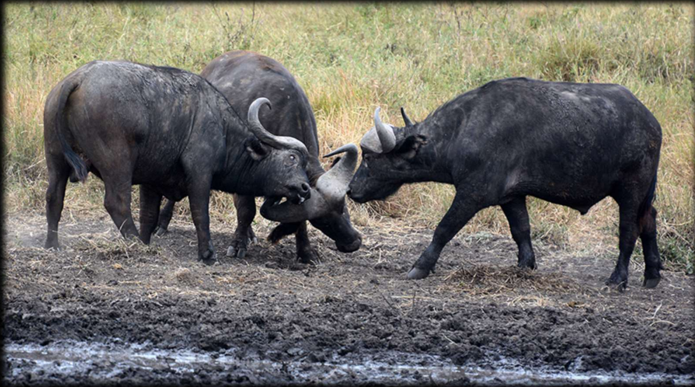
Nr. 2: Büffel sind keine Seltenheit im Ngorongoro-Krater.