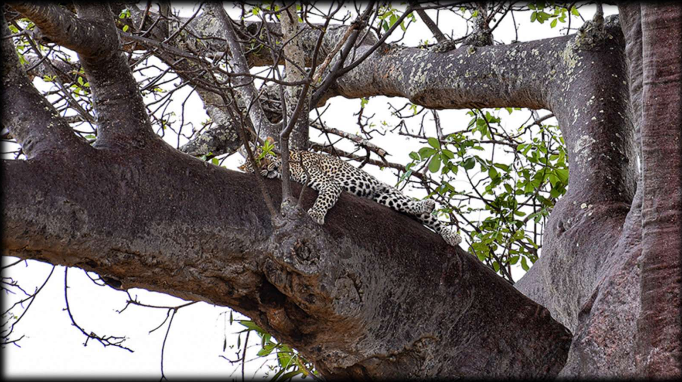
Nr. 4: Auch im Tarangire Nationalpark ist er heimisch: Der Leopard.