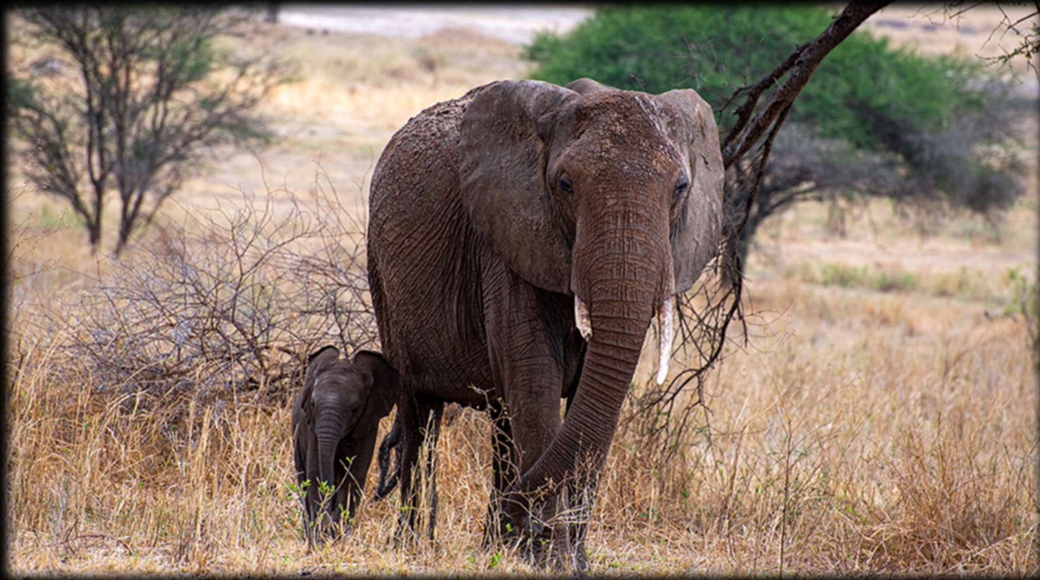
Nr. 3: Der Tarangire-Nationalpark ist ein Paradies für Elefanten.