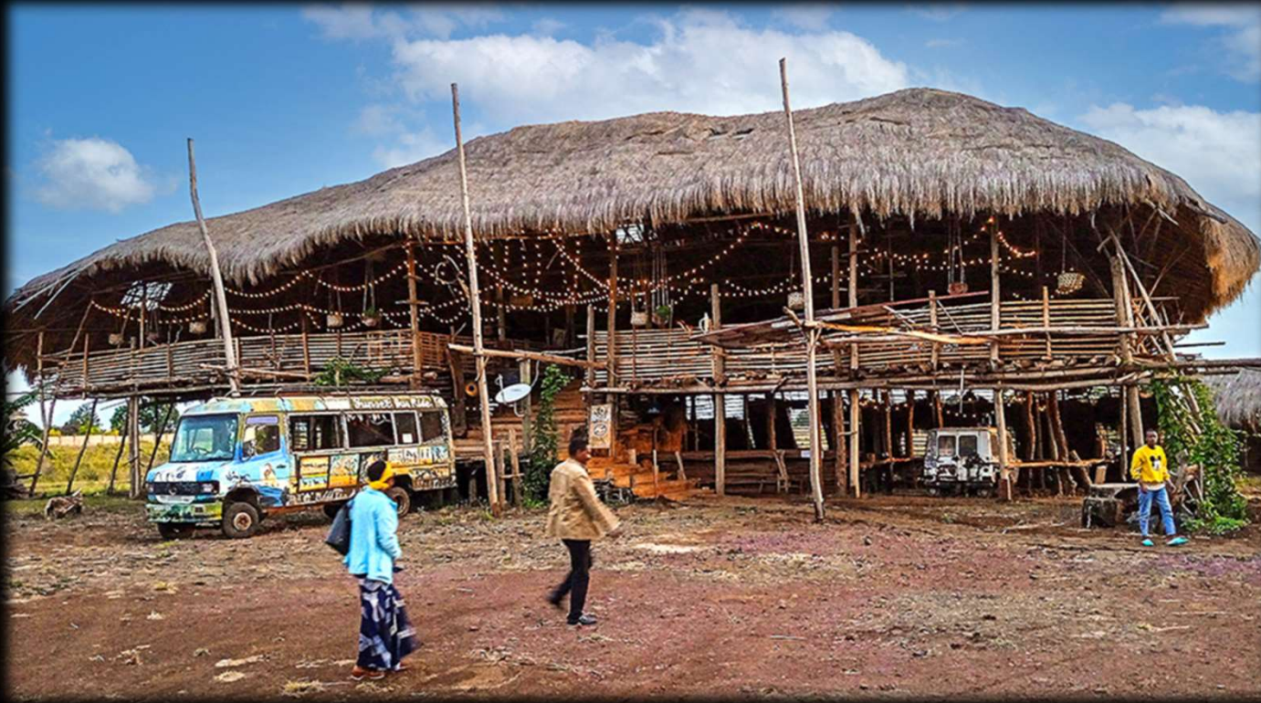
Warten auf Touristen: Neues Lokal in der Nähe von Moshi