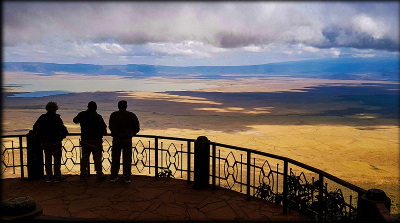
Immer einen Besuch wert: Der Ngorongoro-Krater